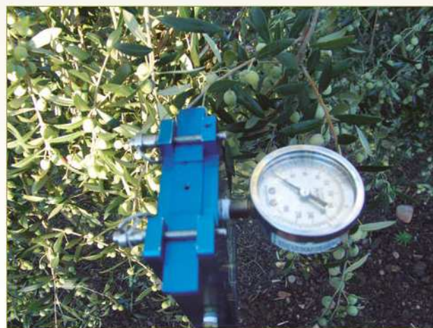
Fotografía 1: Cámaras portátiles tipo "pump-up" utilizadas para medir potencial hídrico de tallo en olivar